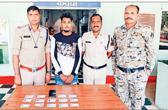
फर्जी सिम सायबर ठगों को बेचने के मामले का खुलासा