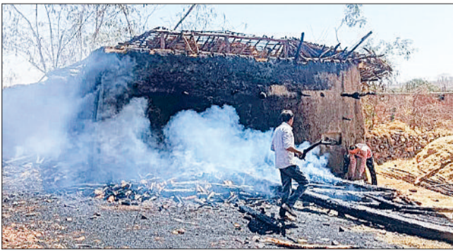
हरिभूमि न्यूज ►► गंडई पंडरिया